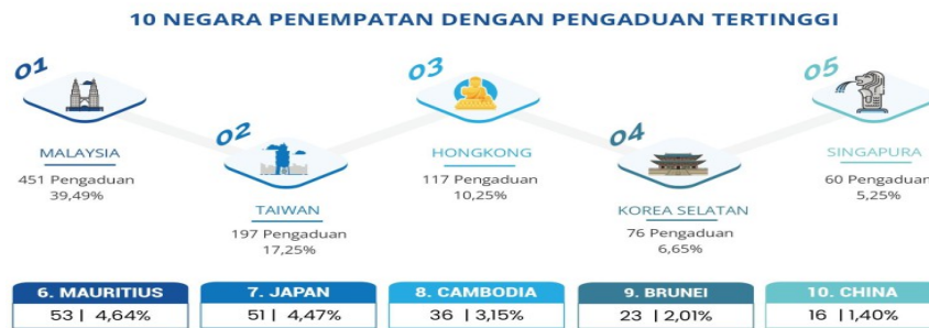
Gambar 1.2 : Data Pengaduan PMI Kawasan Asia Afrika Sumber Data Penempatan BP2MI 2022